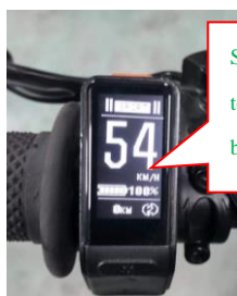
SPORT mode topfart med begrænsning