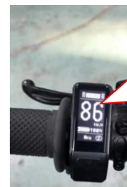
SPORT mode topfart uden begrænsning